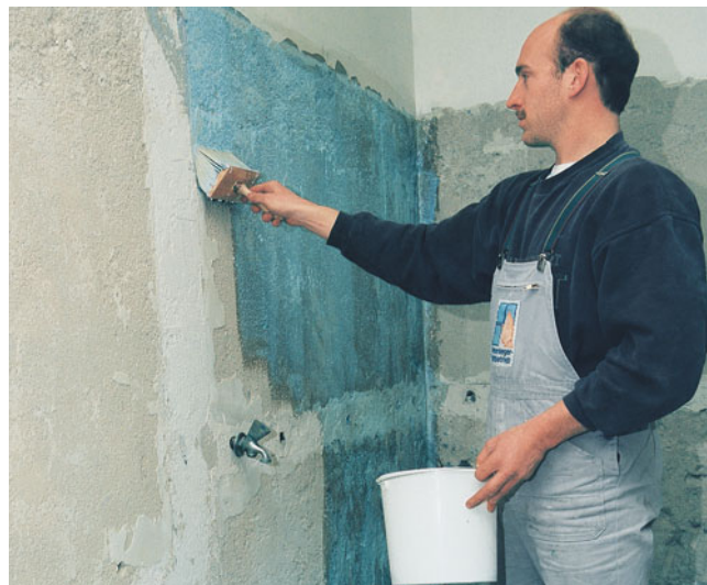
PCI Gisogrund verbessert die Festigkeit und Tragfähigkeit alter, sandender Putze und erhöht die Haftung von Fliesen, Putzen und Tapeten.

Weitere Informationen zur Entsorgung können Sie den Sicherheits- und Umwelthinweisen der Preisliste entnehmen.