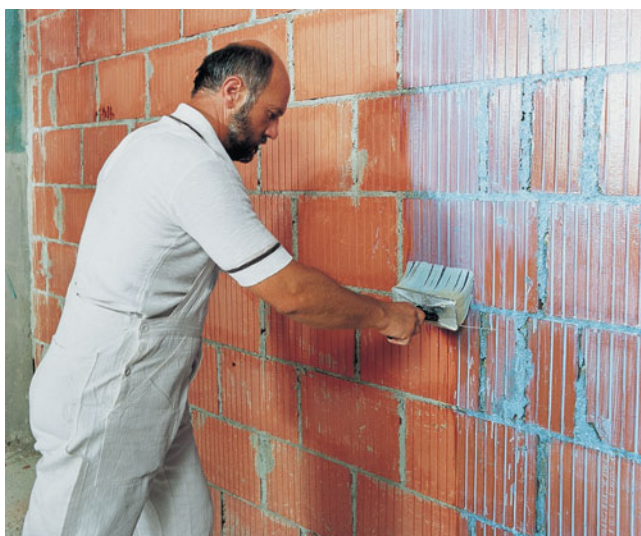
PCI Gisogrund verbessert die Haftung von Gips- und Kalkgipsputzen an Ziegelmauerwerk.